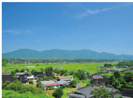
勝央町 / Shoo town

人口約9万7千人で、暮らしに必要なまちの基盤が充実。保育園(所)・幼稚園・認定こども園から高校・高専・大学まで各種教育・保育・医療施設が整い、のびのび安心して子育てが可能。仕事は3000を超える事業所があり、特に製造業は全国有数の技術力を持つ金属・機械産業、木工加工が有名。