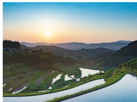
久米南町 / Kumenan town

人口約1万1000人の小さい町だが、光回線や上下水道などの都市的生活インフラが整備されていて、西日本有数の規模を誇る工業団地を有する。高速道路のICもあり、交通アクセスは良好。ブドウやモモなどの果樹栽培も盛んで、新規就農者の移住も多い。不便の無い田舎暮らしができるまさに“ほどよい!田舎”