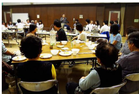
9/27 (火) あば村村民交流会×研修生・岡大歓迎会の開催。和やかに交流。