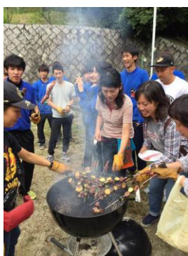
10/1 (土) 日本BBQ協会の初級検定を受講。あばで実践します。