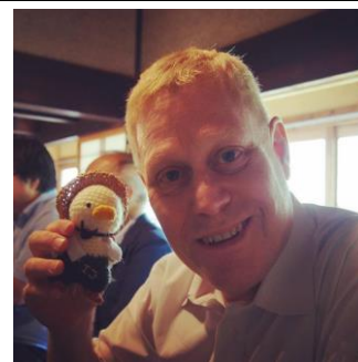
9/21 (水) 古民家再生活動のアレックス・カー氏視察対応。