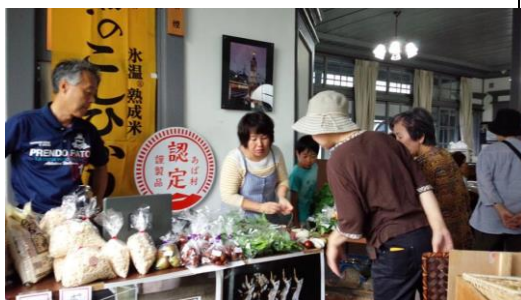
9/18 (日) 城西野菜と魚の市に出店、あばのお米や野菜・加工品を販売。