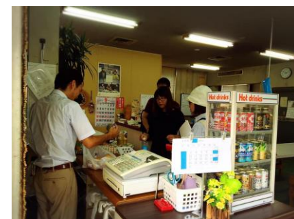
9/28 (水) 岡大生にあば内案内。あば村で買い物してくれました。