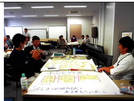
10/12 (水) エコツアーキーパーソン養成研修に参加。みっちり学習。