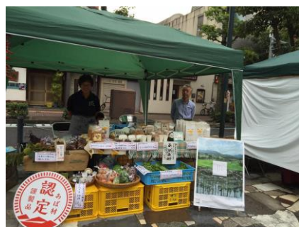
9/25 (日) 岡山市内で行われたイベントに出店、あばのPRと販売。